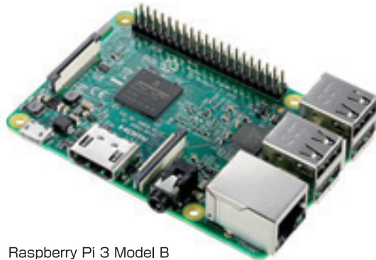
Raspberry Pi 3 Model B