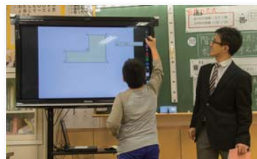
タッチペンの様々な機能を使って

石田先生:皆「てれたっち」を使いたいようで、発表の時は積極的に手を挙げます。普段は消極的な児童も進んでタッチペンを手にして、「皆の前で発表したい!」となるから驚きです。間違えてもデジタルだからやり直しがきくという、心理的なハードルの低さもやる気につながるのかと推測しています。また、「てれたっち」は書き込んだものを保存できますから、次の授業で振り返りとして見せることもできます。