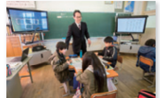
ディスプレイ2台と黒板を併用

夏目校長先生: 電子黒板の良いところは、思考の流れができることだと考えています。先生が板書をする間に児童の思考が途切れてしまうと元に戻るのが大変で、授業にロスが発生してしまいましたが、「てれたっち」の活用でそうした心配もなくなりました。