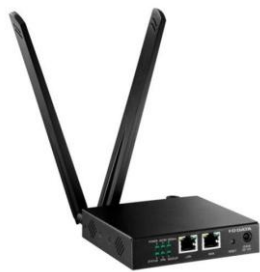
「マルチキャリア M2Mルーター」

現在ICT(情報通信技術)分野でIoTとともに注目を集めるM2M(エムツーエム)とは、Machine-to-Machineの略語で、機器同士をネットワークで接続して情報をやりとりする通信形態の総称です。M2Mルーターは安定したM2Mを実現するための機能を備えたネットワーク接続機器として、エネルギー関連、設備の監視、自動車分野等を中心とした産業市場で活用されていますが、昨今のモバイル回線の低価格化の進展に伴い、新事業やサービスが創出され、様々な市場での活用が見込まれています。