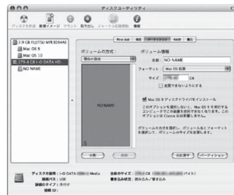
※画面はMac OS X 10.3.3での例です。

初期化後、以下の画面が表示される場合があります。[続ける]ボタンをクリックします。