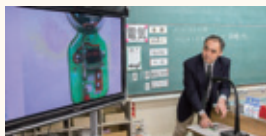
①ベルの模型を書画カメラでTVに投影します。