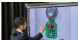
③グループごとに討議した結果を発表し、先生が講評します。