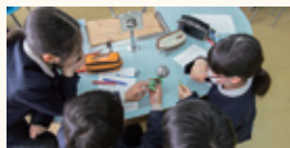
②グループに分かれ、実物を見ながら仕組みを考えます。