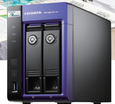
導入商品 タイムスタンプソリューション 「eviDaemon」組み込み済み 2ドライブアプライアンスBOX APX-TSFI/5P

1946年の創業以来、電線事業をはじめとし、産業発展の基盤となる大切なライフラインを支える北日本電線株式会社（宮城県仙台市）。知的財産防衛の有効な手段である先使用権制度の活用に向けて、アイ・オー・データ機器のタイムスタンプソリューション「eviDaemon」組み込み済み2ドライブアプライアンスBOX APX-TSFI/5Pを導入。選定に至るまでの背景と利用状況を研究管理室の三浦俊範（みうらとしのり）様にお話を伺いました。