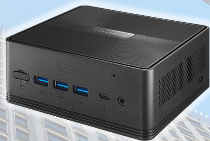
テレワークテルLite (MPC-LV22/TWTLシリーズ)