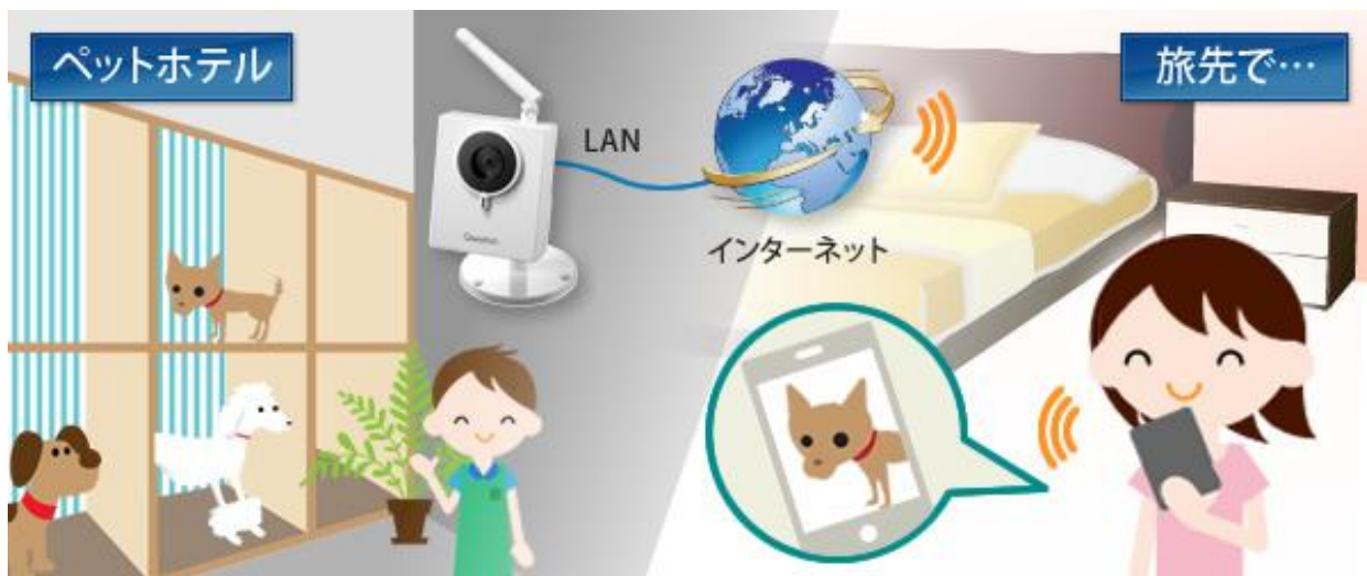
■「WEBカメラサービス」イメージ図