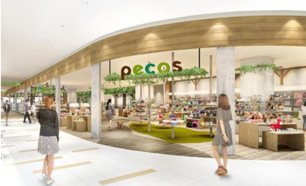
■ pecos(ペコス) 幕張新都心店 2階イメージ

また、法人の用途にも特化した高機能モデル「TS-WPTCAM」も発売。2013年12月現在で5商品をラインナップ。家庭から法人まで、見守り用途にご利用いただけるよう、今後もネットワークカメラ関連の商品の拡充をはかってまいります。