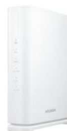
互換性を確認した4製品

当社とエレコム株式会社は、2023年2月8日に発表した通り（※）ネットワーク機器及びそのサービス分野に関する業務提携を続けており、今回の動作検証はその一環として行ったものです。