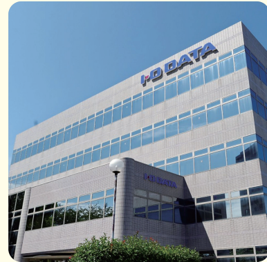
▲本社(金沢)今年で50周年

私たちは、デジタル生活を便利にするための商品(周辺機器・サービス)を作っています。2026年で創業50周年を迎え、私たちが作る液晶ディスプレイ(映像を映す機械)は、国内で特にたくさんの人に使われています。社名の「I」「O」は、コンピュータのことばで、「Input=入れる」、「Output=出す」という意味があります。「データを入れたり出したりすることを、もっとかんたんで、便利にしたい」という思いで、ものづくりをしています。