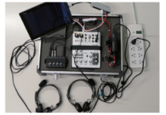
レンタル機材一式の内容